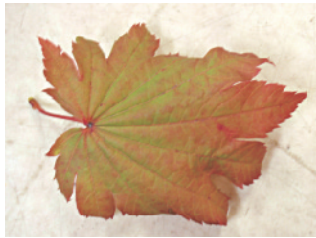
異常落葉の葉。水枯れ症状。

この時期、人も参りますが木々達もかなり参っております。異常落葉や突然死する植木も多々、対応しております。…そこで必要になってくるのが、「水やり」です。ですが、水さえやってあげれば木は元気になる訳でもありません。毎日こまめに水をやるのが良いように思われがちですが、実は木にとってはあまり良いことではありません。こまめな水やりで土の中の空気が少なくなると、根の呼吸が阻害され、根は空気を求め地表近くへ上がってきます。地表が上がって来た根は、乾燥に弱いので水やりを忘れるとすぐに枯れてしまう恐れがあります。こまめに水やりを始めたなら、永遠に続けなければなりません。しかも根ぐされしやすくなります。「じゃあ、どうすればいい？」って事ですが、木の枝張り部分の下に、直径10cm、深さ1m位の穴を開けてその穴にゆっくり、たっぷりあげるのが理想的です。穴の間隔は50cm位で結構です。そうすると根は地中深く根を張ることが出来ます。結果、乾燥が続いても木は自分の力で乗り越える事ができます。